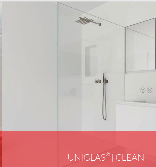
UNIGLAS® | CLEAN

Trotz regelmäßiger Reinigung verliert das Glas von Ganzglasduschen, Duschwänden und Duschkabinen mit der Zeit seine Brillanz. Kleine milchige, raue Stellen entstehen auf der Glasoberfläche, wo sich bevorzugt Kalk, Schmutz und gesundheitsgefährdender Schimmel anlagern können.